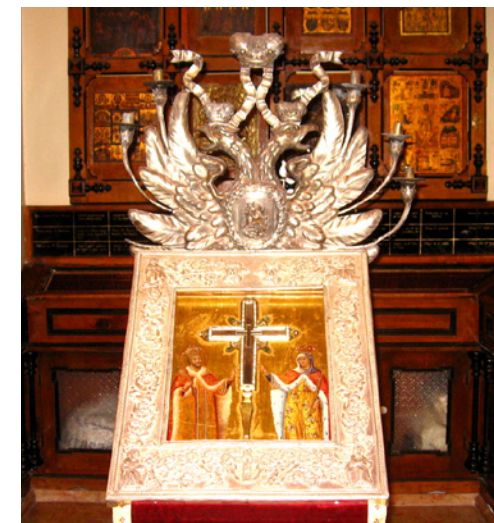
Одна из самых больших из известных частей Креста. Иерусалим, Храм Гроба Господня

Сейчас часть Креста Господня покоится в ковчеге в алтаре греческого храма Воскресения в Иерусалиме. Встретить частицы Креста можно по всему миру, поклониться им можно и в Москве.